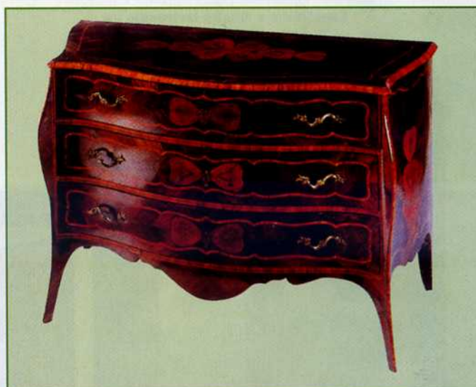
12. Cassettone lastronato in palissandro Misure: 130 x 66, h 90 Stima: euro 80.000 (Pandolfini, marzo 1995)