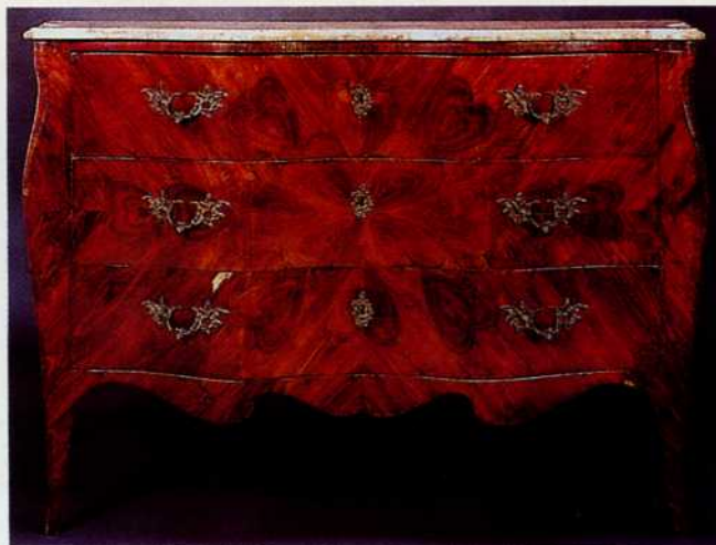
10. Cassettone lastronato in legno viola Misure: 140 x 61 h 93 Stima: euro 60.000 (Boetto, settembre 2002)