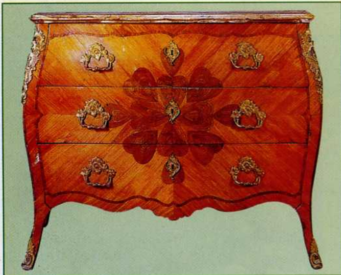
9. Cassettone lastronato in legno di rosa e palissandro. Misure: 115 x 57, h 91 Stima: euro 60.000 (Boetto, settembre 2002)