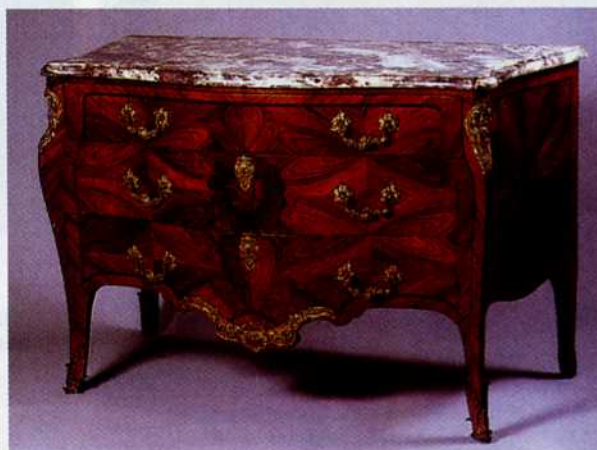
14. Cassettone lastronato in legno di rosa e di viola Misure: 122 x 55, h 84 Stima: euro 50.000 (Finarte, marzo 2003)