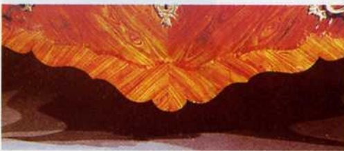
particolare foto 1

Questa rubrica si propone di evidenziare, regione per regione, alcuni mobili del Settecento considerati tipici, ossia caratteristici di un dato ambito culturale.