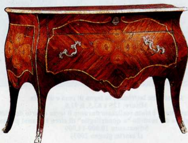
13. Cassettone lastronato in legno di rosa e di viola Misure: 147 x 63, h 82 Stima: euro 25.000 (Finarte)