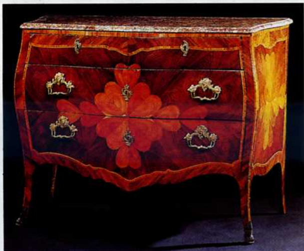
11. Cassettone lastronato (Semenzato, settembre 2001)