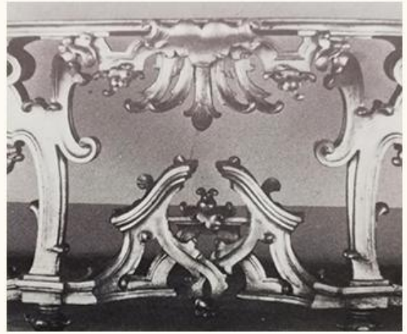
A sinistra: Intagliatore bolognese, Console, c. 1750 (part.), Bologna, Pinacoteca Nazionale. A destra: Intagliatore bolognese, Tavolo parietale, c. 1750 (part), Bologna, Pinacoteca Nazionale.

I molteplici riferimenti culturali che sono stati ricostruiti intorno a questa coppia di picchiotti, la loro integrità e la ricercatezza formale, esaltate dalla sopravvivenza della doratura, concorrono complessivamente a sostanziare il valore storico e artistico di queste opere, che rappresentano perciò testimonianze significative dell'elevata qualità esecutiva e soprattutto del raffinato equilibrio tra funzionalità e bellezza, raggiunti a Bologna alla metà del XVIII secolo.