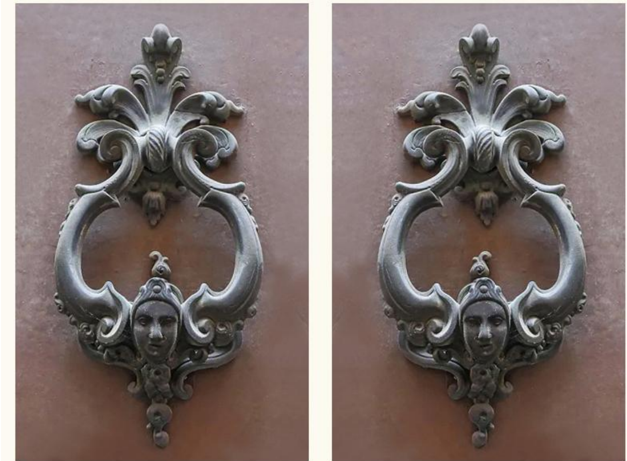
Coppia di picchiotti in bronzo di Palazzo Dondini Ghiselli (1751-1753), via Barberia 23, Bologna.