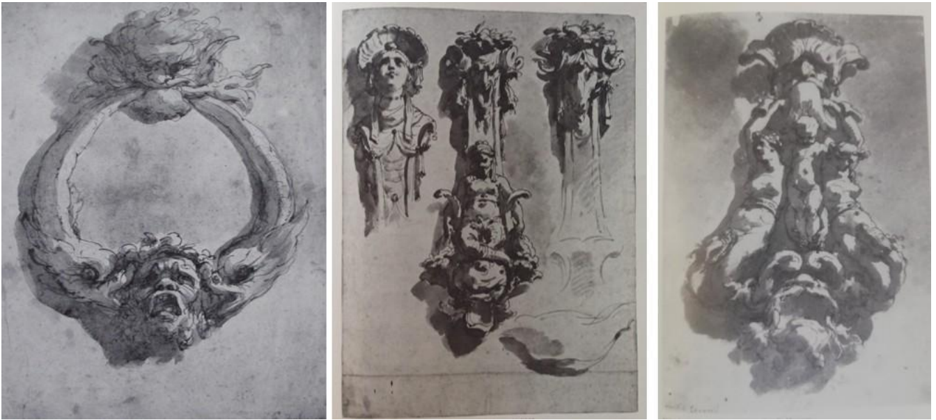
A sinistra: Ubaldo Gandolfi, Studio per un picchiotto con delfini e mascheroni, penna e bistro, New York, Collezione privata.